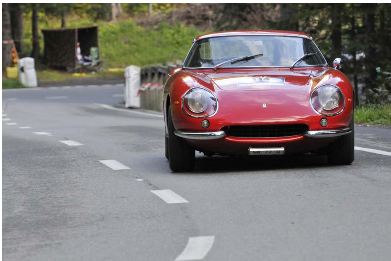
Ferrari 275 GTB Long Nose (1964) mit Startnummer 114.

Drei Tage Sonnenschein und beste Bedingungen auf der Bergrennstrecke: Die 20'000 Besucher kamen an der Arosa Classic Car auf ihre Kosten.